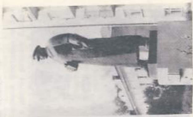
Памятник К. Е. Ворошилову

Имя Климента Ефремовича Ворошилова (1881—1969) известно советскому народу. Луганский слесарь, герой обороны Царицына в 1918 году, соратник В. И. Ленина, первый маршал Советского Союза, дважды Герой Советского Союза и Герой Социалистического Труда, Председатель Президиума Верховного Совета СССР в 1953—1960 годах. По ходатайству ветеранов гражданской и Отечественной войн в дни празднования 50-летия образования СССР (30.XII.1972 г.) К. Е. Ворошилову установлен памятник на набережной города. Скульптура, возвышающаяся на постаменте, обращена к главной улице России — великой реке Волге.