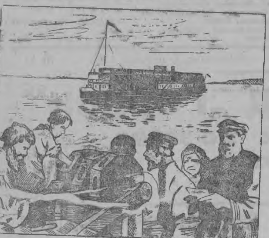
На рисунке сверху — пароход „Герцен“, на котором происходит розыгрыш крестьянского займа. Внизу группа представителей от крестьян на палубе „Герцена“, присутствующих при розыгрыше.

Заготовка семенной ржи осуществляется в форме кооперации. Успешная работа была проведена в этом отношении, закупившейся в сумме 85.450 рублей.